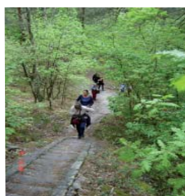
Sortie randonnée à Milly-la-Forêt

Une Association de Familles au service des Familles